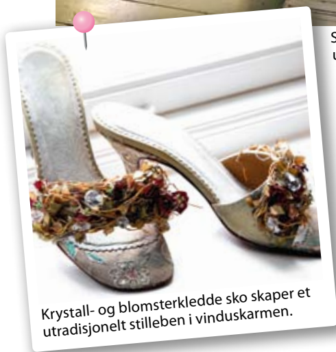
Krystall- og blomsterklede sko skaper et utradisjonelt stilleben i vinduskarmen.

idé ADVENTSSTAKE: Tre perler på en metalltråd og surr det rundt fire kubbelys som du setter på et fat. Legg dine gamle perlesmykker rundt lysene på fatet, og du har skapt en vakker dekorasjon.