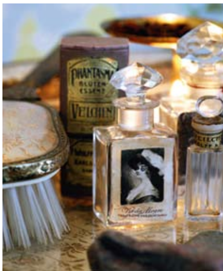
Vakre flakonger og en dekorativ børste fungerer som lekker pynt på badet.

idé TOALETTPAPIR PÅ STANG: Bruk en gammel lampefot i smijern som toaletterullholder.