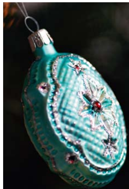
På juletreet henger både arvede og nye julekuler i fin, gammel stil.