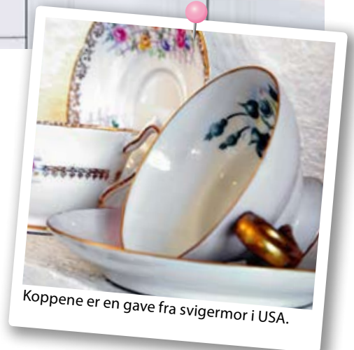
Koppene er en gave fra svigermor i USA.