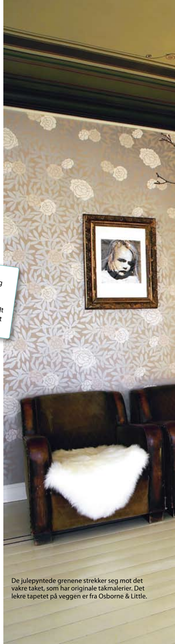
De julepyntede grenene strekker seg mot det vakre taket, som har originale takmalerier. Det lekre tapetet på veggen er fra Osborne & Little.