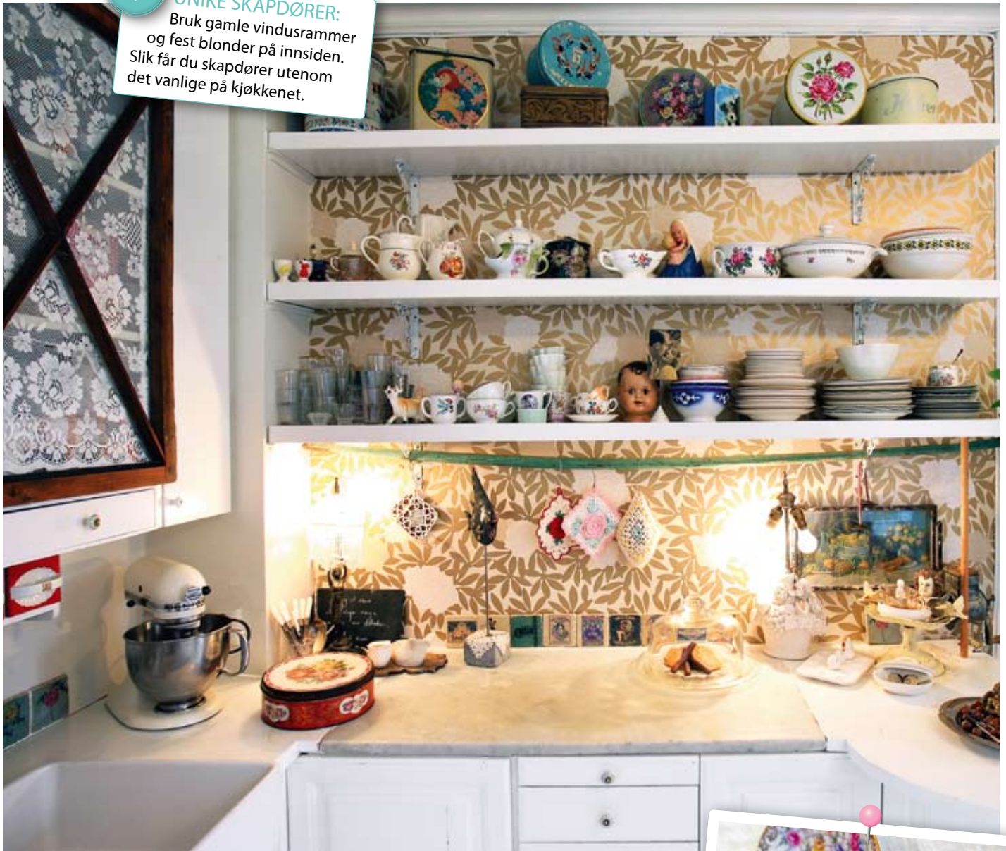
Tapetet på veggen er fra Osborne & Little. Alt på kjøkkenhyllene er arvegods eller kjøpt brukt. De små figurflisene som står på benken er fra Italia.

Bruk gamle vindusrammer og fest blonder på innsiden. Slik får du skapdører utenom det vanlige på kjøkkenet.