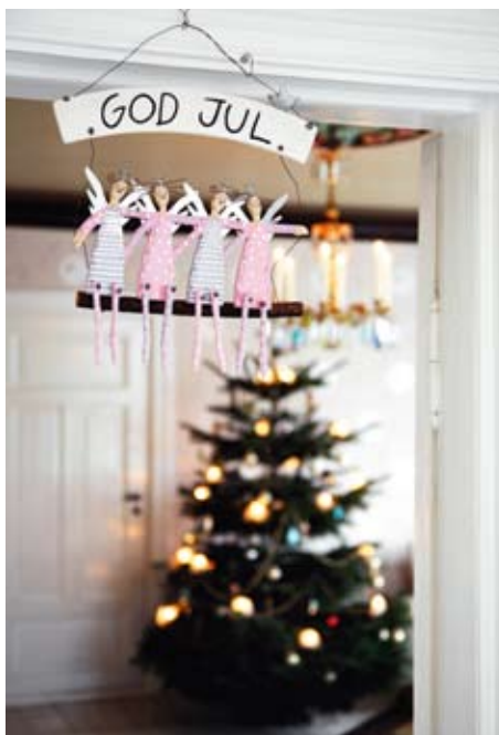
I døråpningen inn til stuen henger et hyggelig juleskilt.